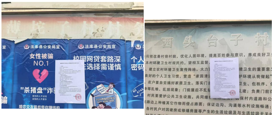
母（薄）坨子村张贴公示