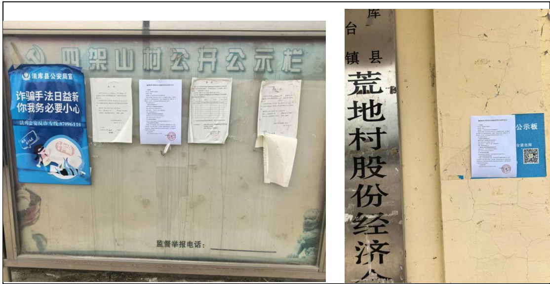
四架山村张贴公示

现场公示时间为 2025 年 6 月 24 日~7 月 7 日，共 10 个工作日。现场公示照片如下：