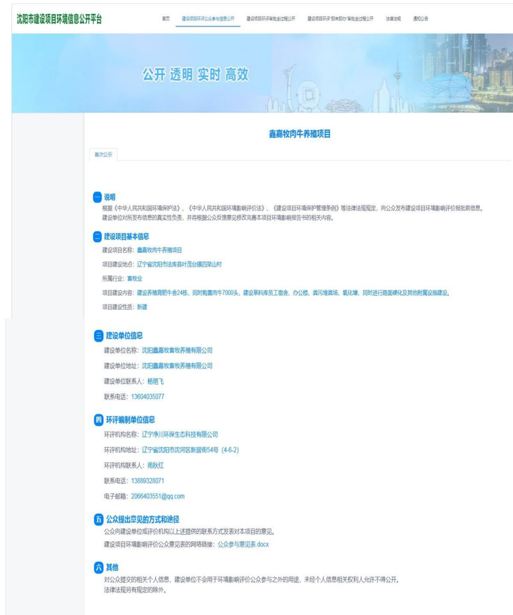
图 2.1-1 第一次网络公示截图

本次公示的载体选择在沈阳市建设项目环境信息公开平台进行公示，本次公示时间为2025年5月20日~6月2日，期限为10个工作日。网络公示网址为 http://open.sypgzx.com/project ，网络公示截图如下：