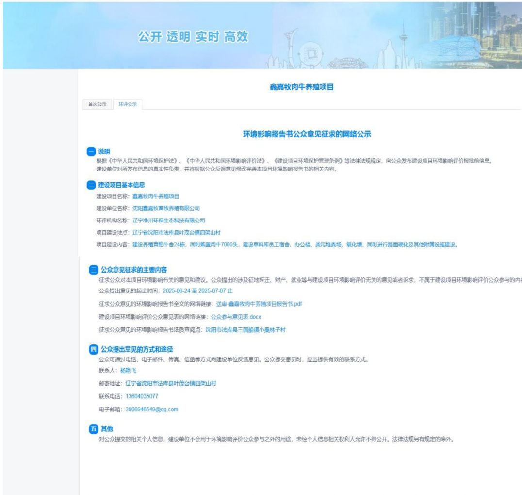
图 3.2-1 第二次网络公示截图