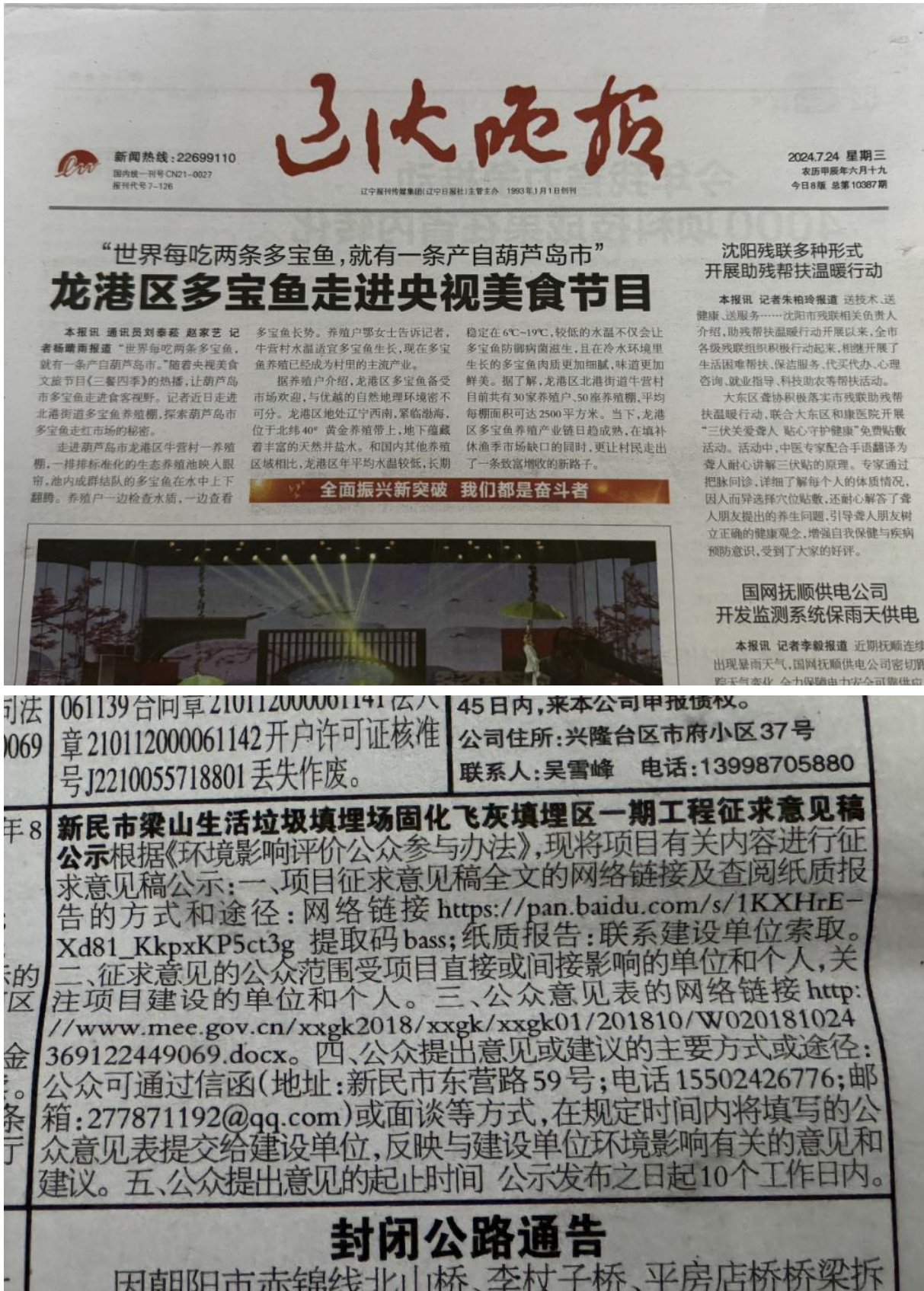
图 3-2 第一次征求意见稿报纸公示