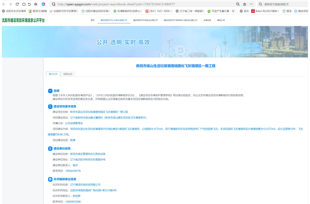
图 2-1 第一次网络公示截图