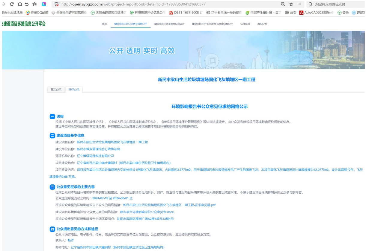
图 3-1 征求意见稿网络公示截图