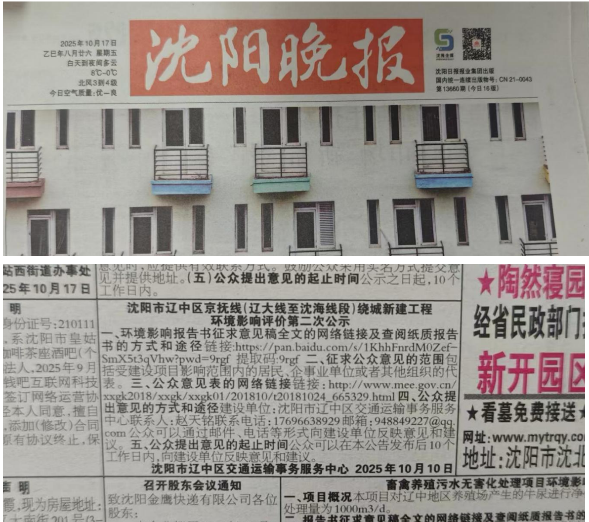
图 4 项目第二次登报公示截图