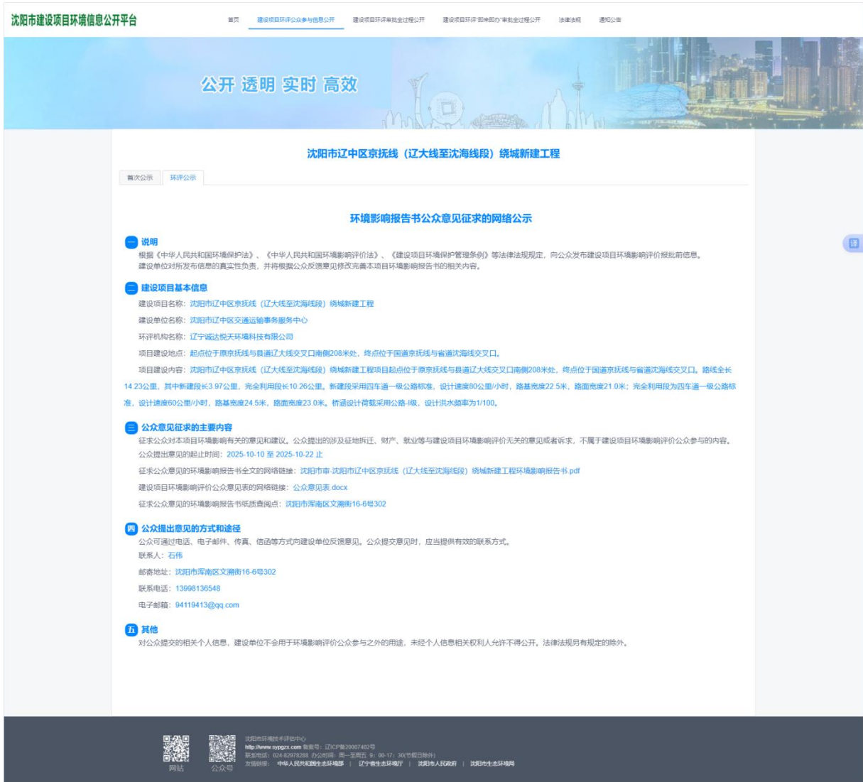
图 2 征求意见稿全文本网络公示截图