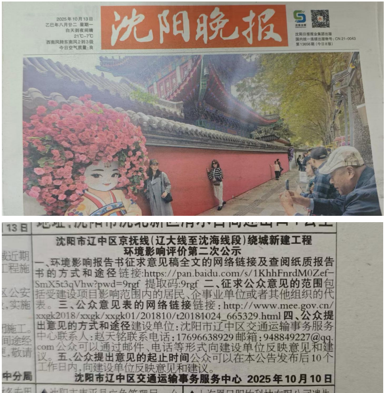
图3 项目第一次登报公示截图