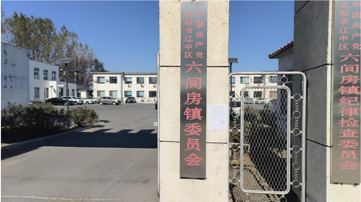
图 5 辽中区六间房政府张贴公告