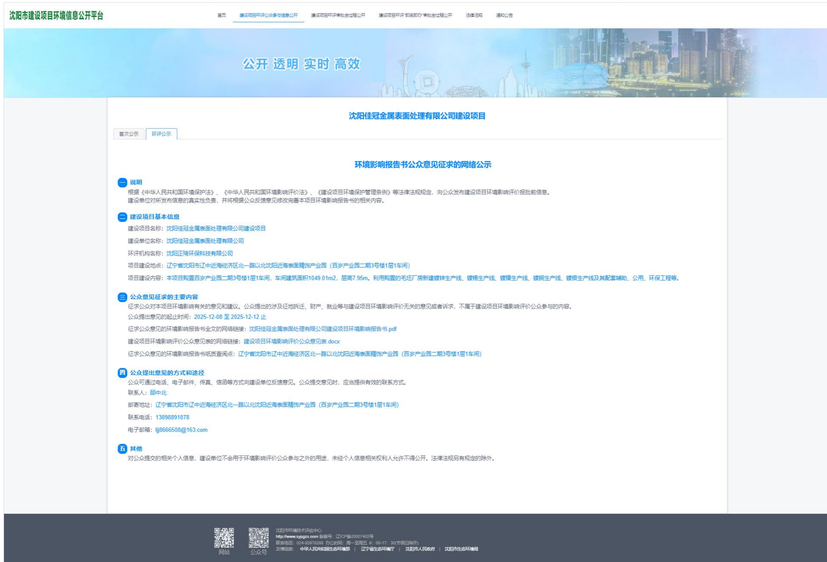
图 3.2-1 征求意见稿网络公示截图