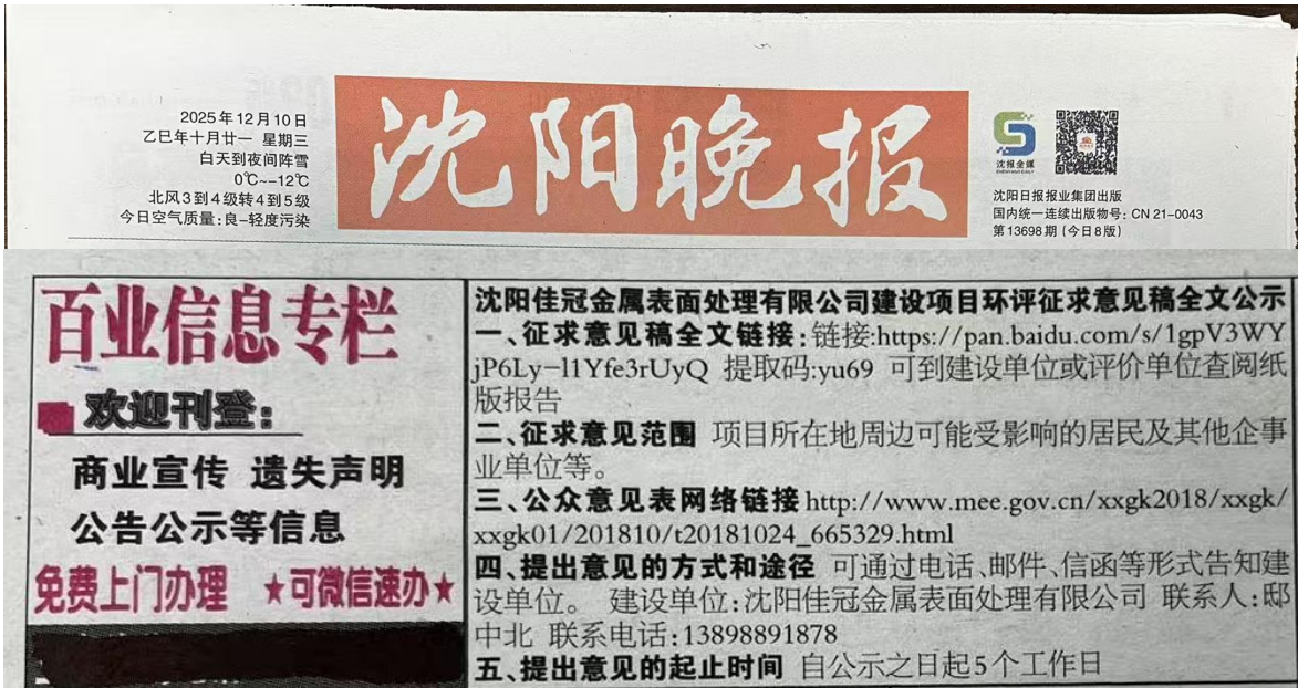
图 3.2-2 2025 年 12 月 10 日报纸公示截图